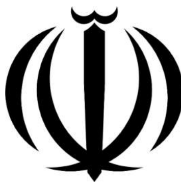
وزارت صنعت، معدن و تجارت